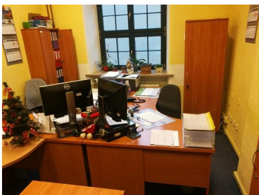
Typowe biurko L 160x120 cm Typowy kontenerek dostawny 50 x 70 cm Typowe szafki zamykane 90 x 35-45 cm Typowe szafki zamykane 60 x 35-45 cm