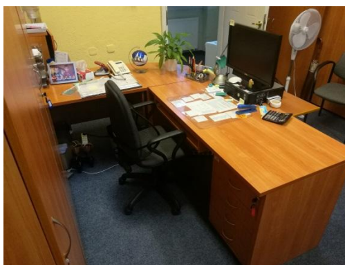
Typowe biurko 140x120 cm Typowy kontenerek mobilny 45 x 50 cm Typowe szafki zamykane 90 x 35-45 cm Typowe szafki zamykane 60 x 35-45 cm