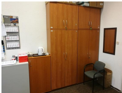
Typowe szafy zamykane 90 x 35-45 cm Typowe nadstawki szaf 90 x 35-45 cm