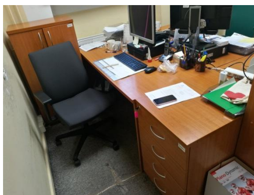
Typowe biurko 140 x 120 cm Typowy kontenerek dostawny 50 x 70 cm Typowe szafki zamykane 90 x 35-45 cm h=110 cm