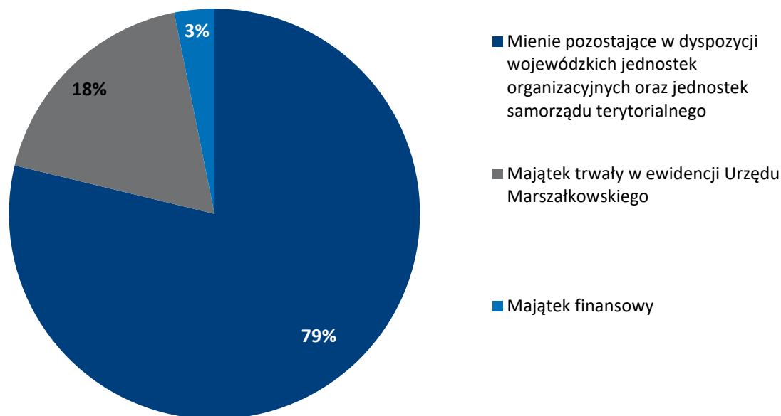
Wykres 1 Udział procentowy poszczególnych grup majątkowych w ogólnej wartości mienia Województwa