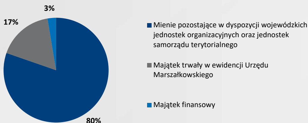
Wykres 1 Udział procentowy poszczególnych grup majątkowych w ogólnej wartości mienia Województwa