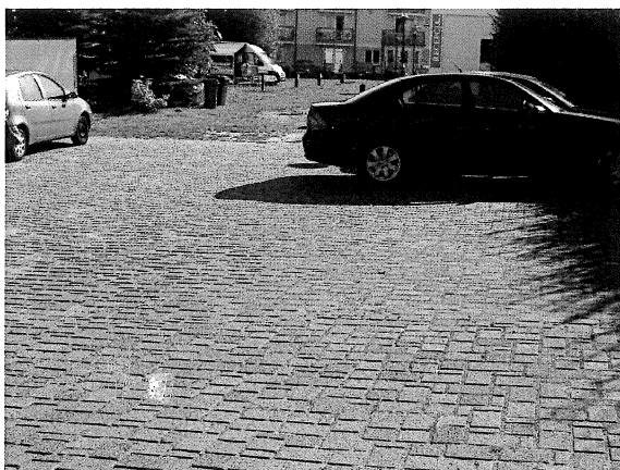
Widok na parking, w głębi stanowiska obozowania (lewa strona), droga wewnętrzna, pawilon recepcji.

W postępowaniu tym nie zostały złamane ani naruszone przepisy prawne, czy też zasady etyki jakichkolwiek norm i procedur.