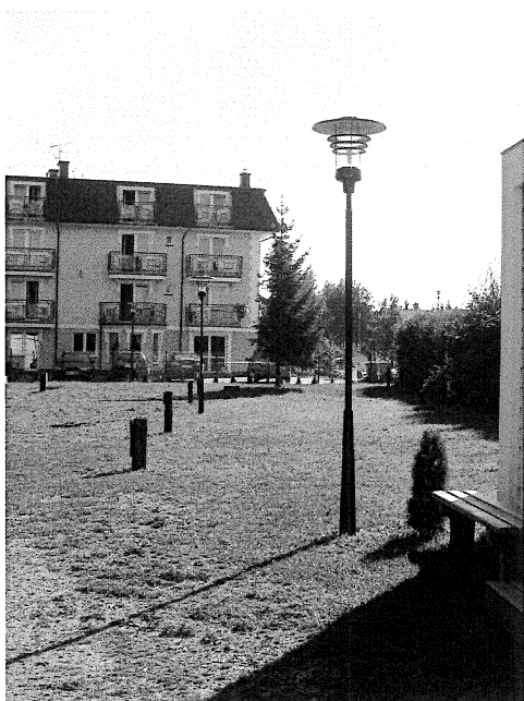
Widok na drogę wewnętrzną i stanowiska obozowania (prawa strona – widoczna ławka i stopnie do recepcji).