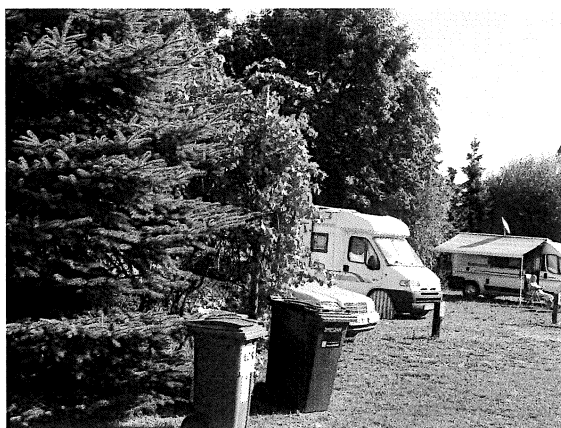
Widok na stanowiska obozowania (lewa strona od recepcji) i fragment drogi wewnętrznej (grunt przed słupkami z numerami stanowisk)