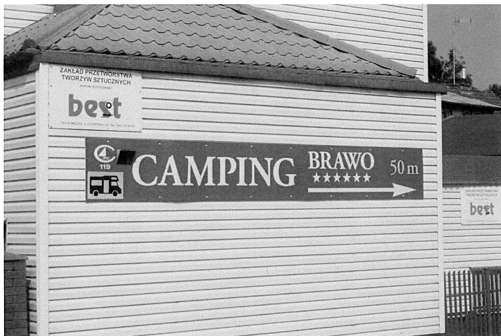
Mielno, 17.07.2014r, zabudowania u zbiegu ul. Lechitów z ul. Północną.