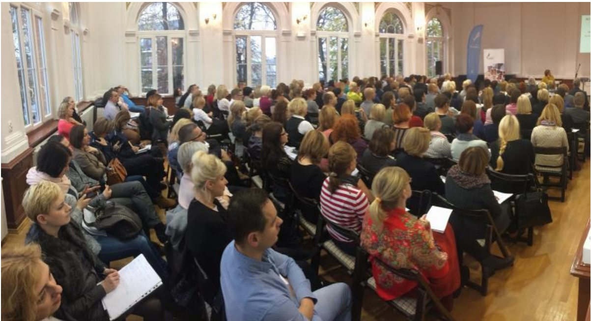
Regionalna konferencja na temat problematyki uzależnień behawioralnych wśród młodzieży pn. „Młodzież, a uzależnienia od czynności” w Świdwinie