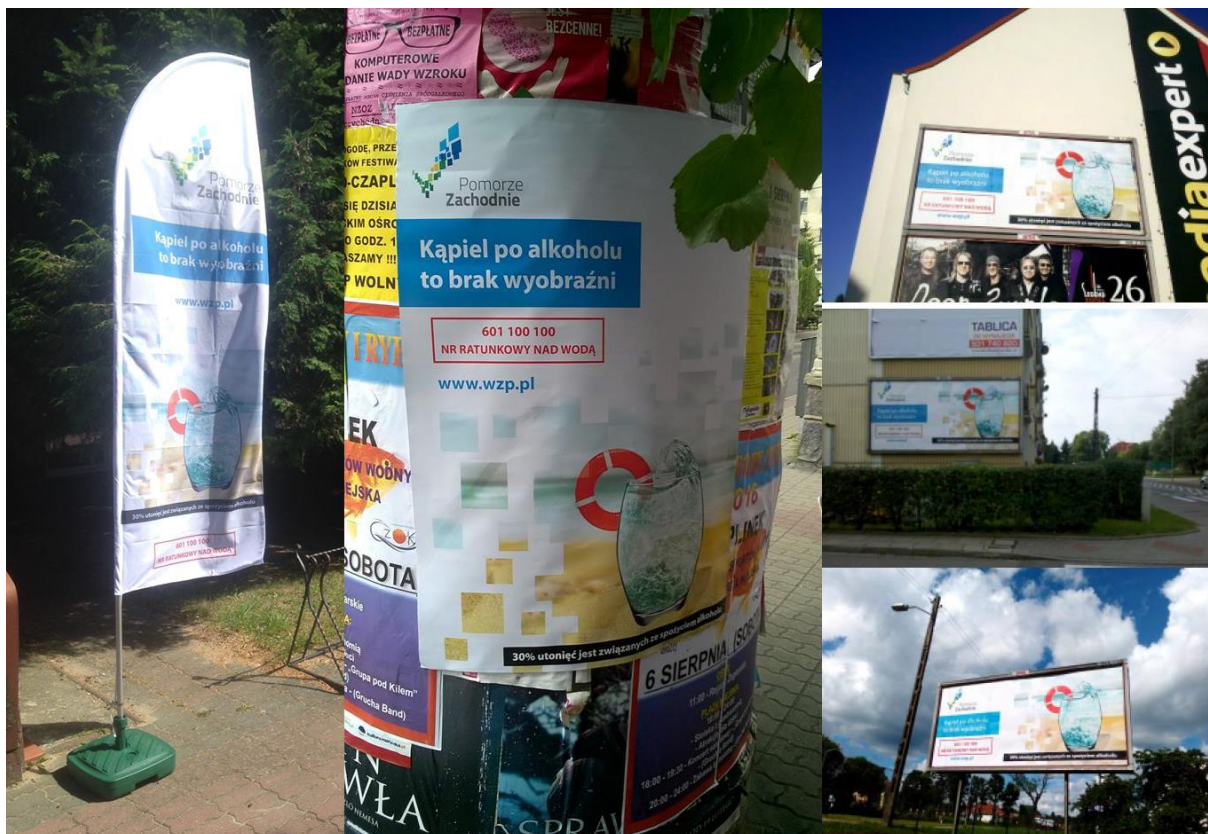
Kampania „Kąpiel po alkoholu to brak wyobraźni”