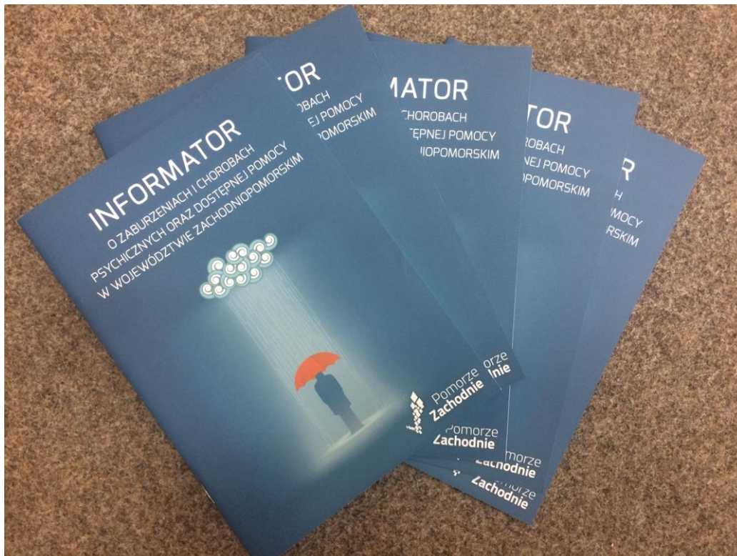
Informator o zaburzeniach i chorobach psychicznych oraz dostępnej pomocy w województwie zachodniopomorskim.