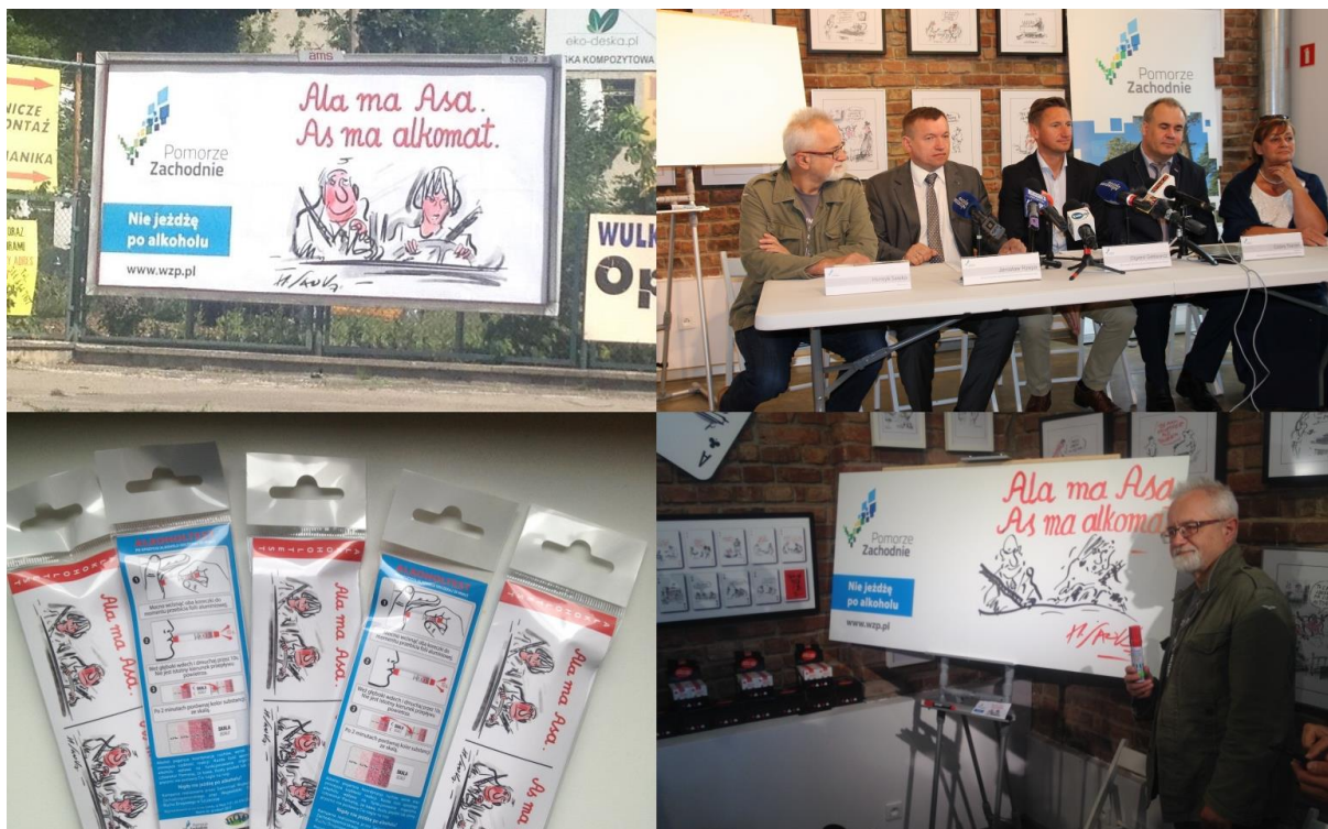
Kampania informacyjna, skierowana do kierowców w celu propagowania trzeźwości podczas prowadzenia pojazdów i ukazania skutków jazdy pod wpływem alkoholu pn. „Nie jeżdżę po alkoholu”.