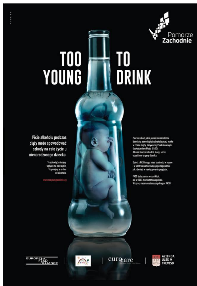
Pomorze Zachodnie brało udział w międzynarodowej kampanii społecznej „Too young to drink” na rzecz podniesienia świadomości zagrożeń wynikających z picia alkoholu przez kobiety w czasie ciąży