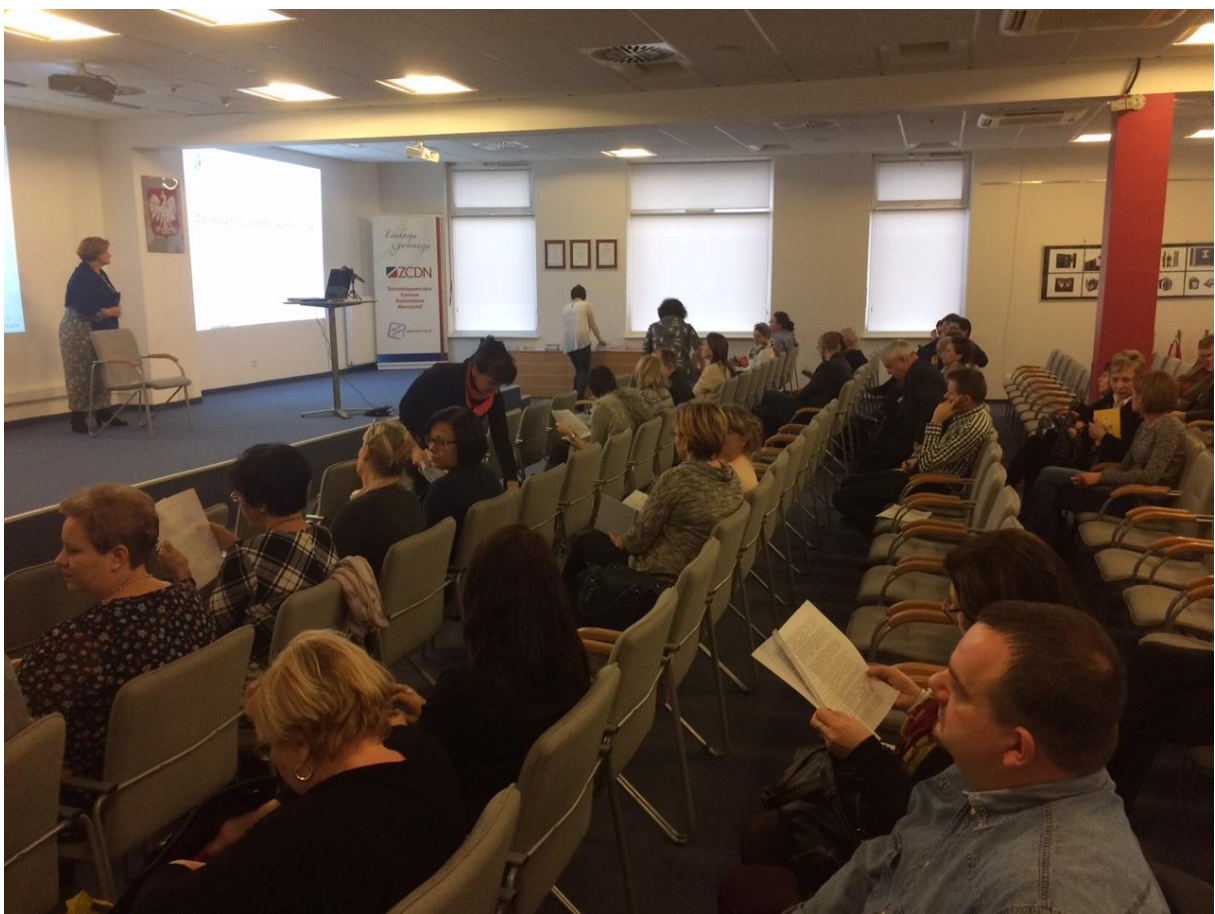
Regionalna konferencja dotycząca problematyki uzależnień skierowana do osób odpowiedzialnych w gminach za rozwiązywanie problemów uzależnień w Szczecinie