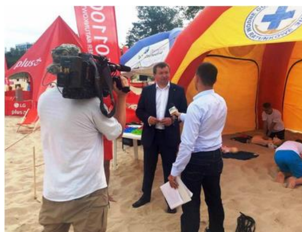
Nie daj się wciągnąć. Kampania promująca modę na aktywność nad wodą bez używek