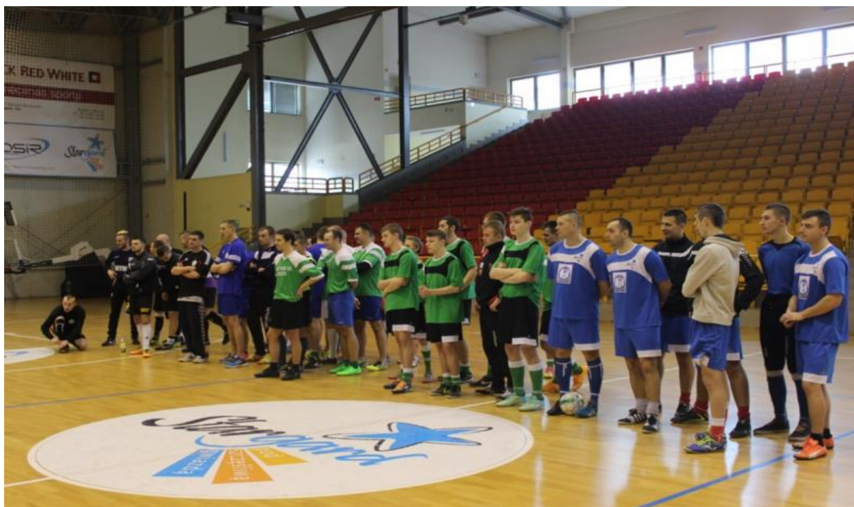
XX-ty Halowy Turniej Piłki Nożnej Klubów Abstynenta Województwa Zachodniopomorskiego