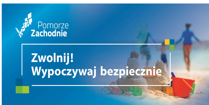
Billboard z kampanii społecznej promującej bezpieczny wypoczynek na terenie województwa zachodniopomorskiego