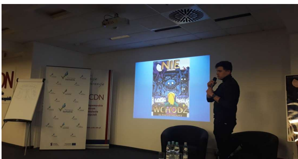
Konferencja edukacyjna pt. „Bezpieczeństwo w sieci. #patotrześci #uzależnienia_behawioralne” (7 listopada 2019 r.)