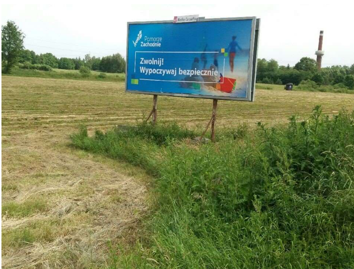
Konferencja inauguracyjna kampanię społeczną dotyczącą bezpiecznego wypoczynku na terenie województwa zachodniopomorskiego (19 czerwca 2019 r.) oraz billboard promujący kampanię.