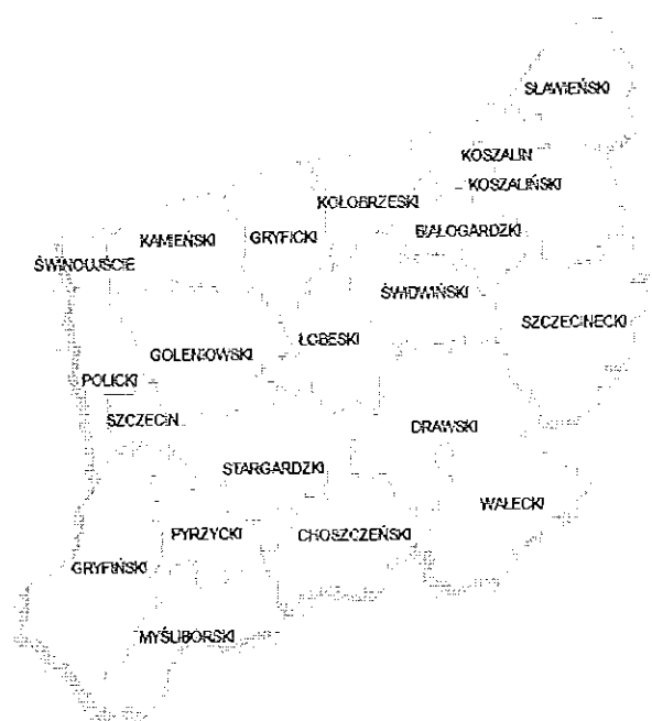
Mapa 1. Województwo zachodniopomorskie z podziałem na powiaty

grodzkie (miasta na prawach powiatu) i 18 ziemskich. Jest to piąty co do wielkości region Polski, o powierzchni 22,9 tys. km 2 , i jedenasty pod względem liczby 1 710 482 mieszkańców 7 , którzy w większości zamieszkują w miastach (wysoki odsetek 70% mieszkańców miast sytuuje zachodniopomorskie na trzecim miejscu pod względem zurbanizowania). Od zachodu graniczy z Niemcami, od północy – przez Morze Bałtyckie – ze Szwecją i Norwegią, od wschodu z województwem pomorskim i od południa z województwami lubuskim i wielkopolskim. Stolicą województwa jest Szczecin.