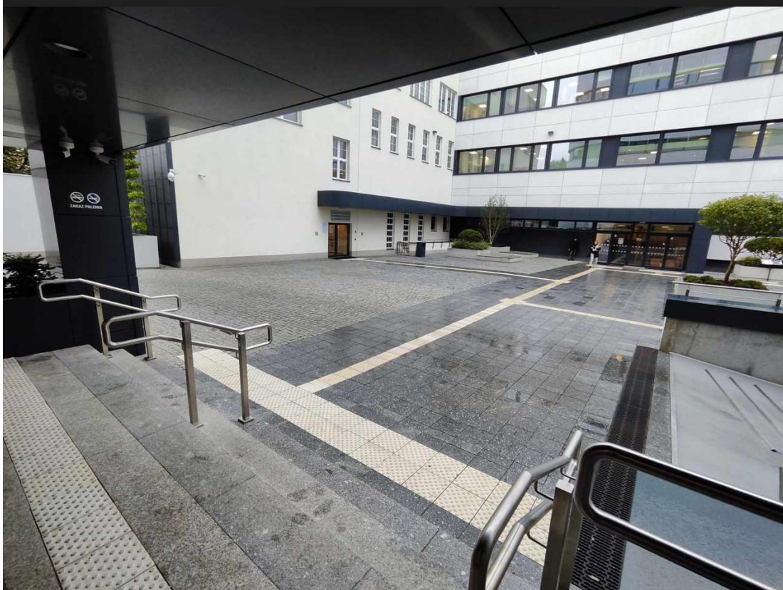
2) atrium budynku UMWZ