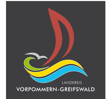
Logo auf dunklem Hintergrund