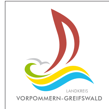
Logo auf weißem Hintergrund

Das Logo besteht aus einer Wort-Bild-Marke.