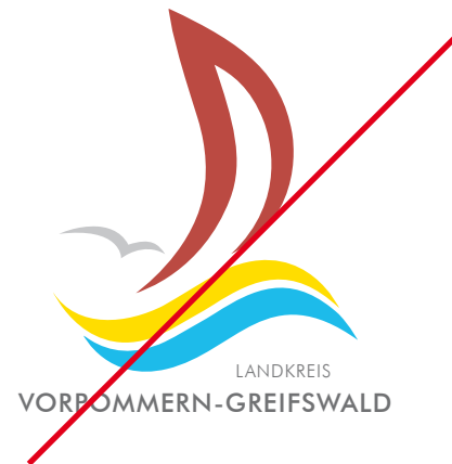
Entfernen von Elementen